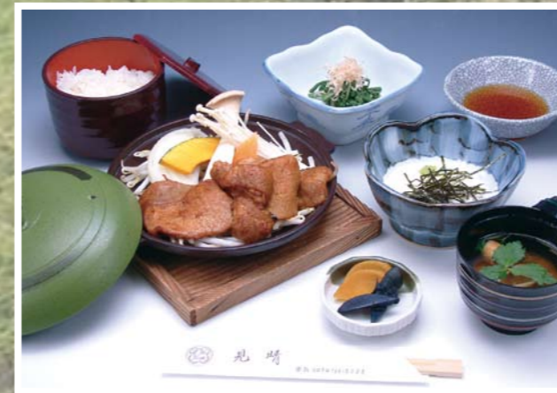
豚味噌漬けの陶板焼き